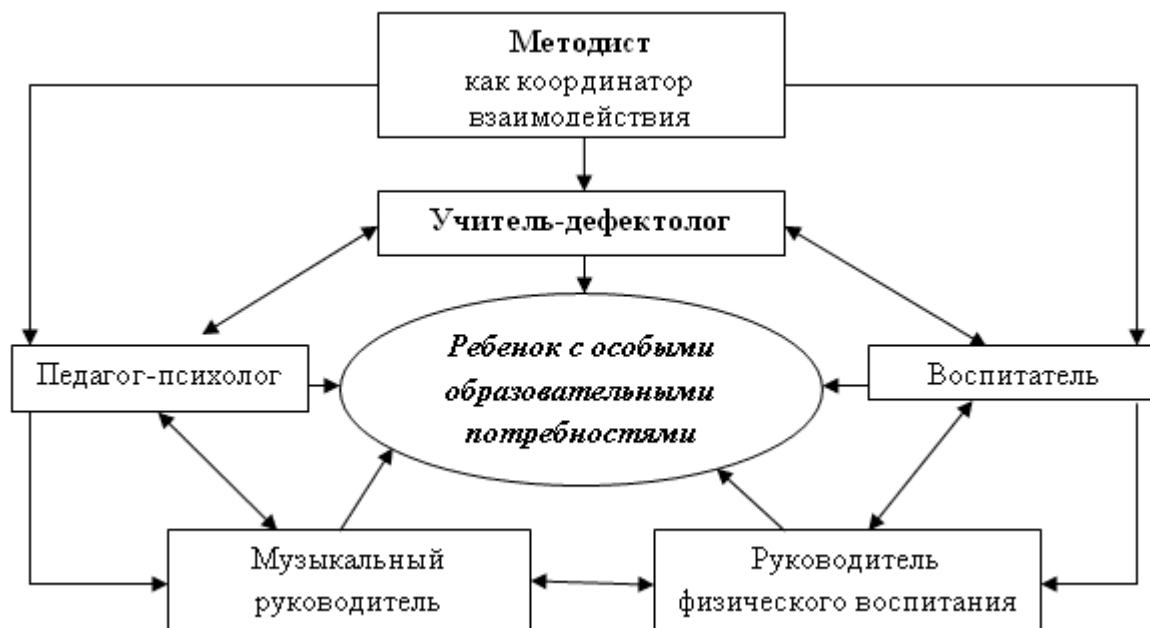
Рисунок 1 – Педагогическая деятельность ДОУ